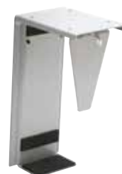
Model 2001 mikro