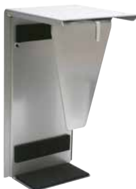
Model 2001 mini