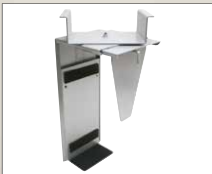
1207-N + 1390